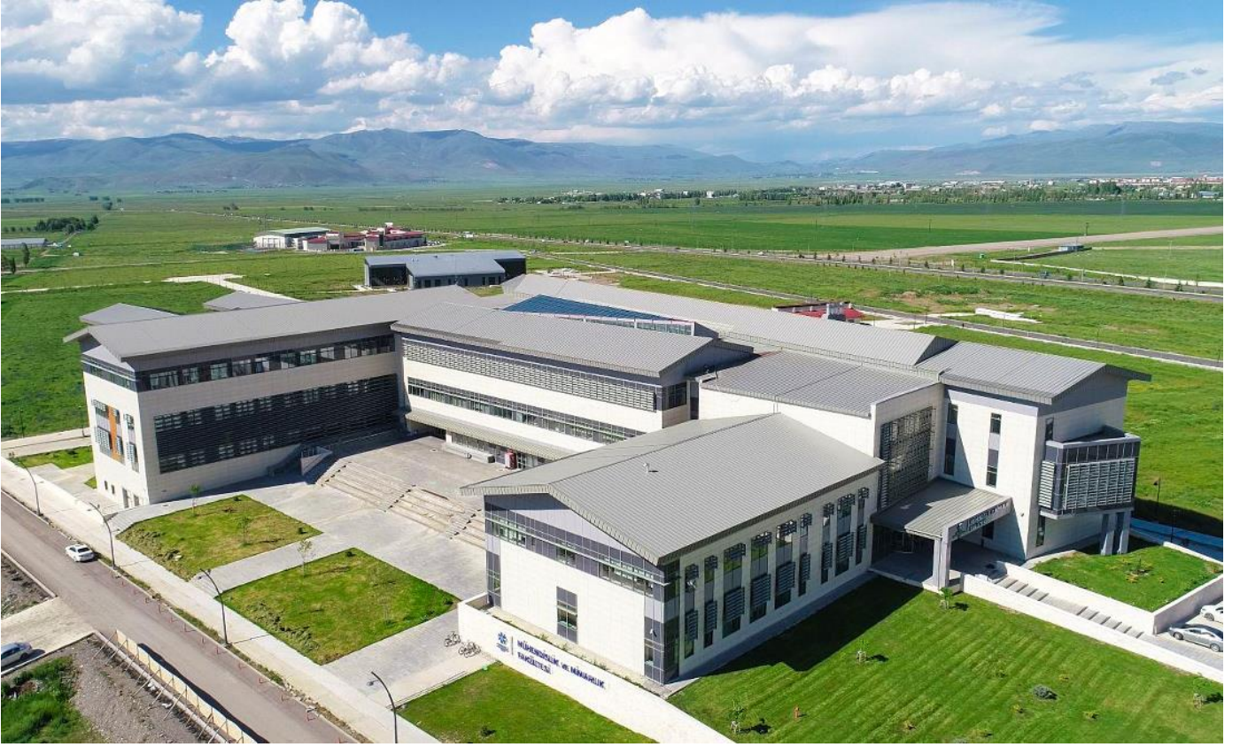
Resim 3: Mühendislik ve Mimarlık Fakültesi

Yapımı tamamlanan 25.245 m 2 'lik Mühendislik ve Mimarlık Fakültesi 2017 yılı içerisinde hizmete açılmıştır.