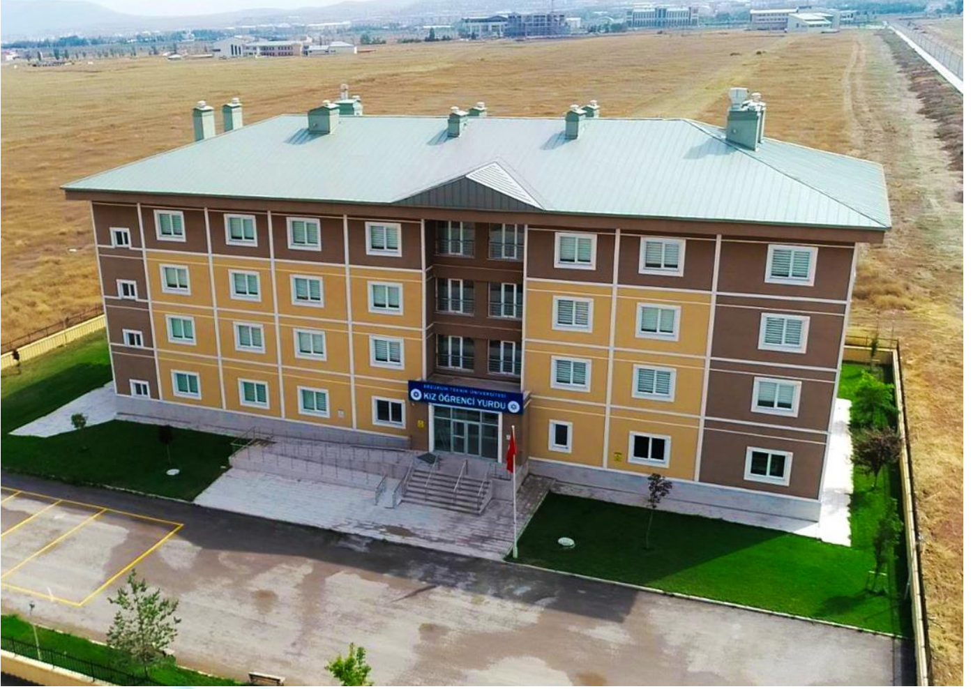
Resim 5: Yurtlar

İş Bankası tarafından üniversitemize bağışlanan 152 öğrenci kapasiteli kız öğrenci yurdumuz aktif olarak hizmet etmekte olup öğrencilerimizin barınma ve sosyal yaşam ihtiyaçlarına cevap vermektedir. 2017 yılı içerisinde 1500 kişilik Kredi ve Yurtlar Kurumu yurtları da kampüs alanımızda hizmete girmiştir.