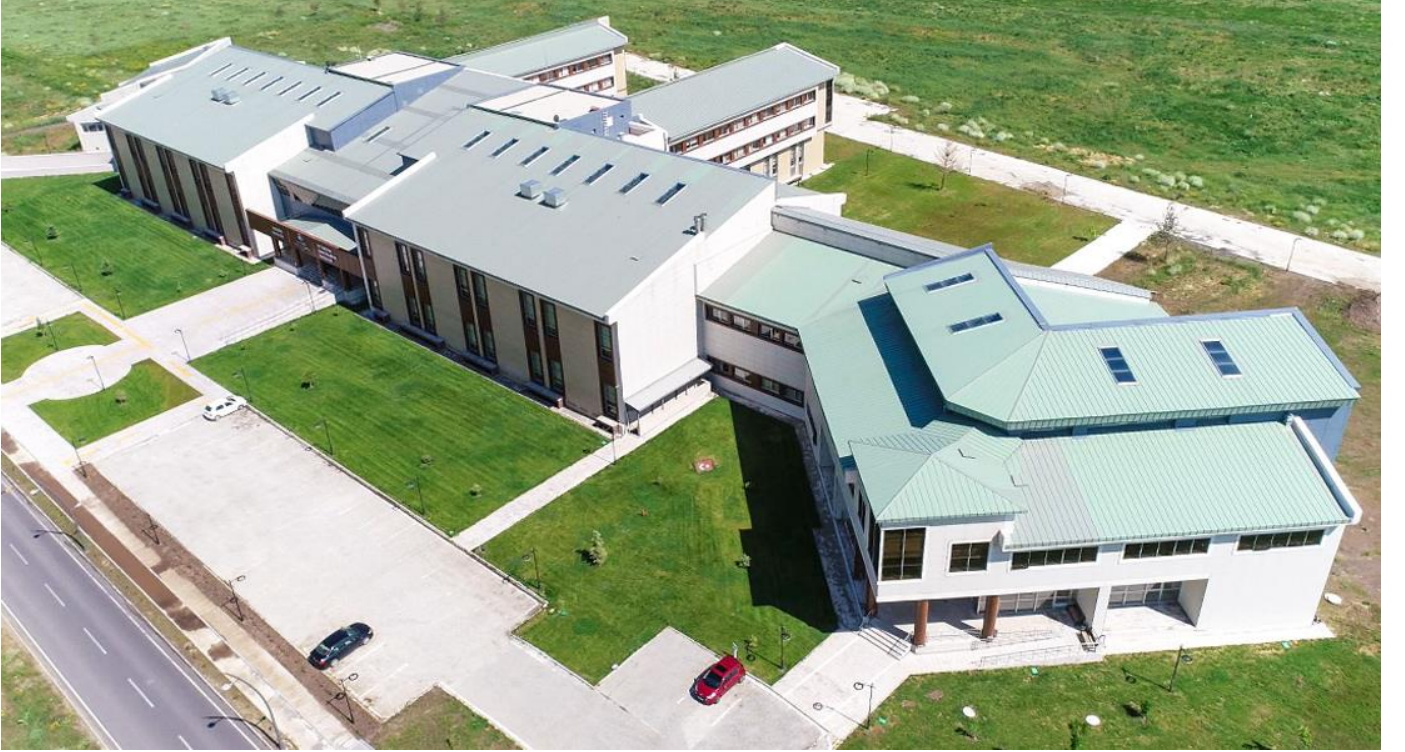
Resim 2: İktisadi ve İdari Bilimler ile Edebiyat Fakültesi

Ardından İktisadi ve İdari Bilimler Fakültesi ile Edebiyat Fakültesine hizmet verecek olan 19.581 m 2 'lik İktisadi ve İdari Bilimler Fakülte binası tamamlanmış olup fakültelerin öğrencileri bu binada eğitimlerini sürdürmektedirler.