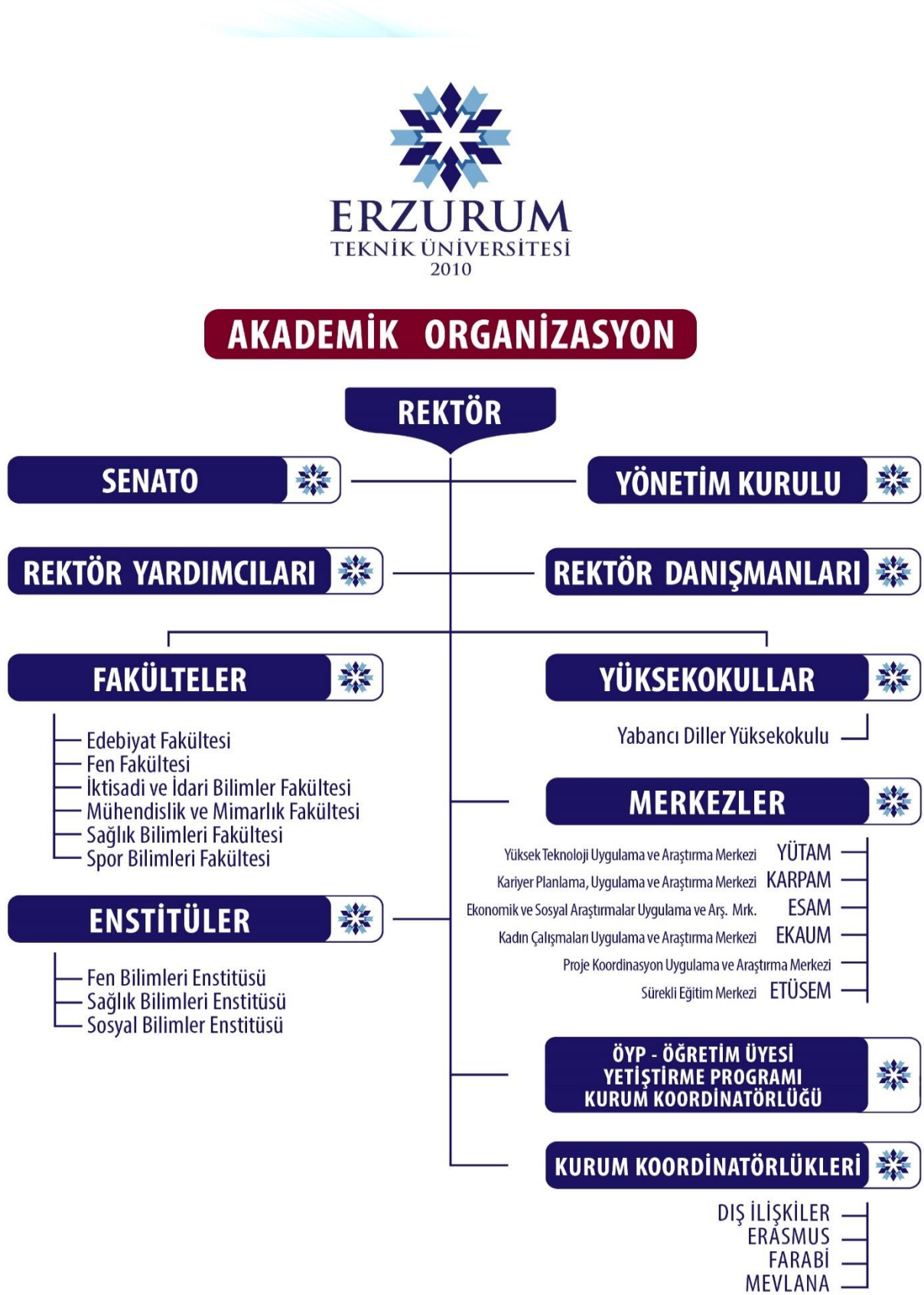
Şekil 1: Erzurum Teknik Üniversitesi Akademik Birimler Organizasyon Şeması