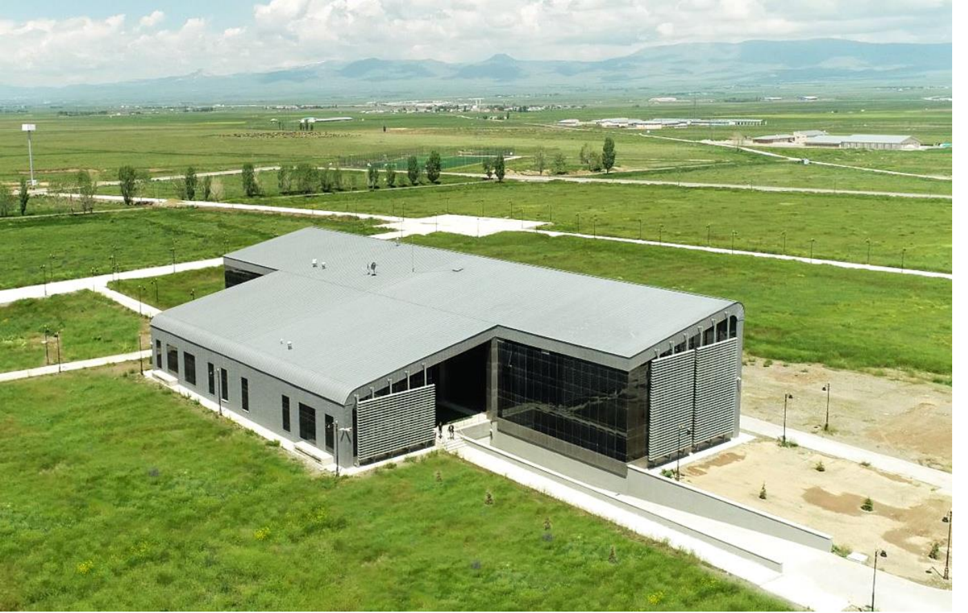
Resim 6: Yüksek Teknoloji Uygulama ve Araştırma Merkezi (YÜTAM)

Gerçekleştireceği nitelikli Ar-Ge çalışmaları ile ilimiz, bölgemiz ve ülkemizin 2023 yılı teknolojik hedeflerine ulaşmasında ciddi katkılar sunmayı kendine şiar edinen 4.700 m 2 'lik Yüksek Teknoloji Uygulama ve Araştırma Merkezi (YÜTAM) 2017 yılı içerisinde tamamlanarak hizmete açılmıştır.