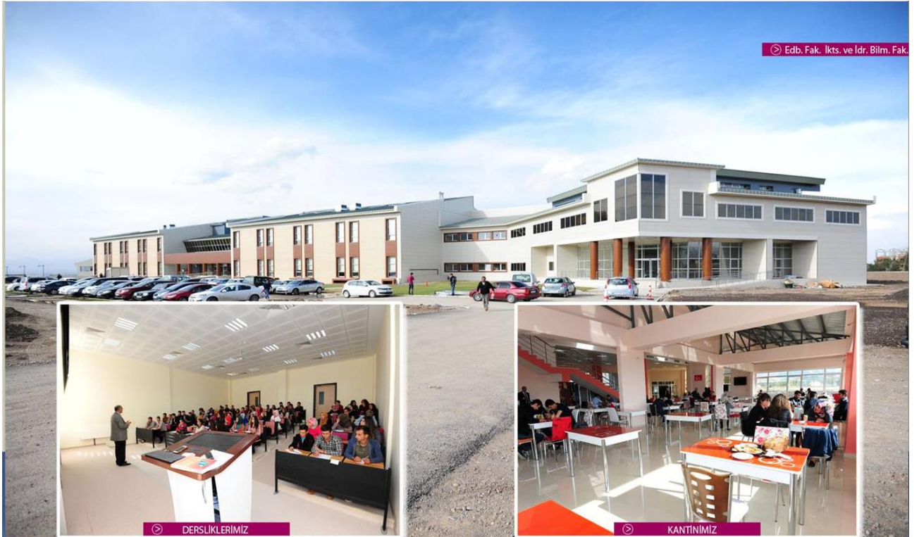
Resim 6: İktisadi ve İdari Bilimler Fakültesi Binası

Mühendislik ve Mimarlık Fakültesi ile Yüksek Teknoloji Uygulama ve Araştırma Merkezi inşaatları devam etmekte olup Mühendislik ve Mimarlık Fakültesi 2016 yılı Aralık ayı itibariyle, Yüksek Teknoloji Uygulama ve Araştırma Merkezi ise 2017 yılı Ocak ayı itibariyle faaliyetlerine başlayacaktır.