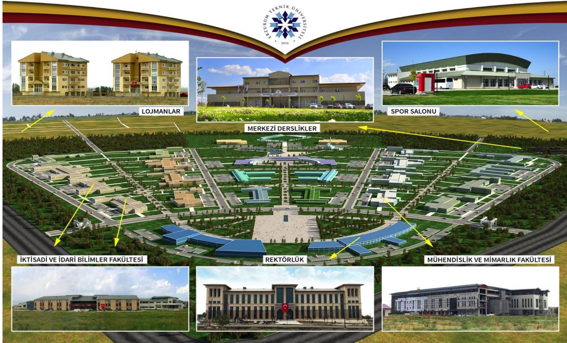
Resim 1: Erzurum Teknik Üniversitesi Yerleşke Planı