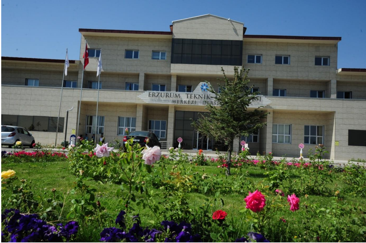
Resim 4: Merkezi Derslikler

Merkezi Derslik binası toplamda 7.124 m 2 kapalı alana sahiptir. Kapalı Spor Saloluna Dönüştürülebilir Derslikler ise 3.178 m 2 'lik bir kapalı alana sahip bulunmaktadır.