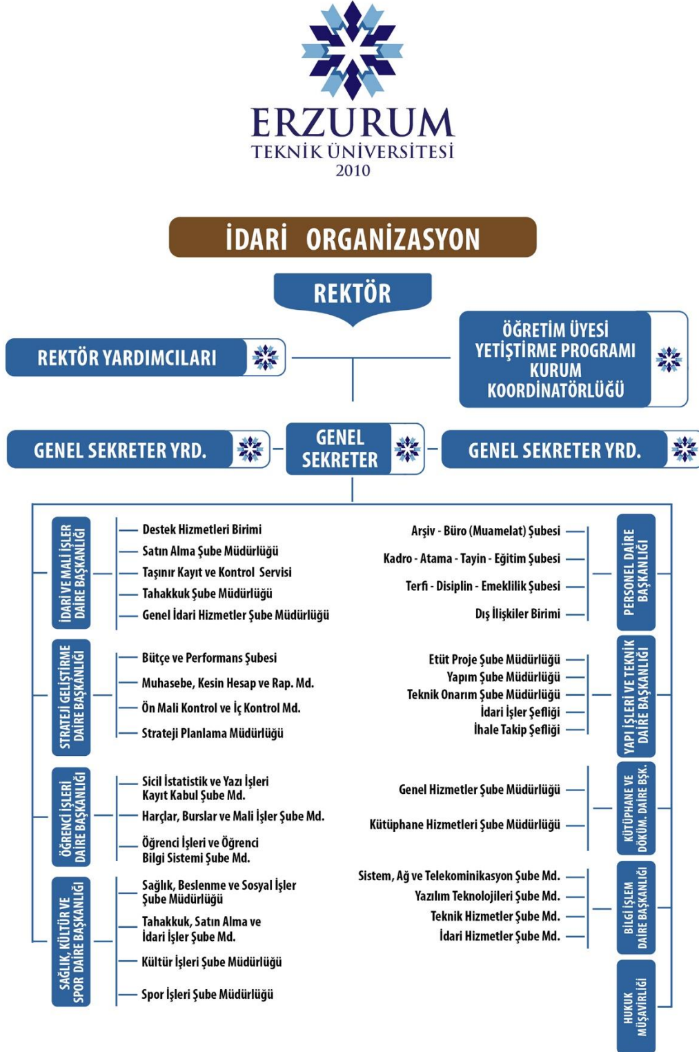
Şekil 2: Erzurum Teknik Üniversitesi Rektörlük Örgütü İdari Birimler Organizasyon Şeması