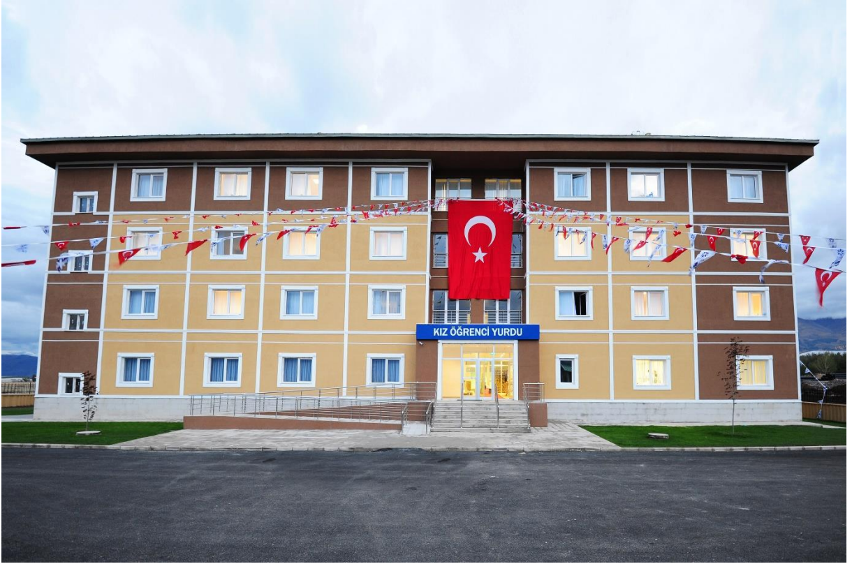
Resim 9: Kız Öğrenci Yurdu Binası

Yerleşkemizde ayrıca İş Bankası ile yapılan protokol çerçevesinde 3.625 m 2 'lik bir kapalı alana sahip bulunan 150 kişi kapasiteli Kız Öğrenci Yurdu 2015 yılından beri öğrencilerimize hizmet vermektedir.