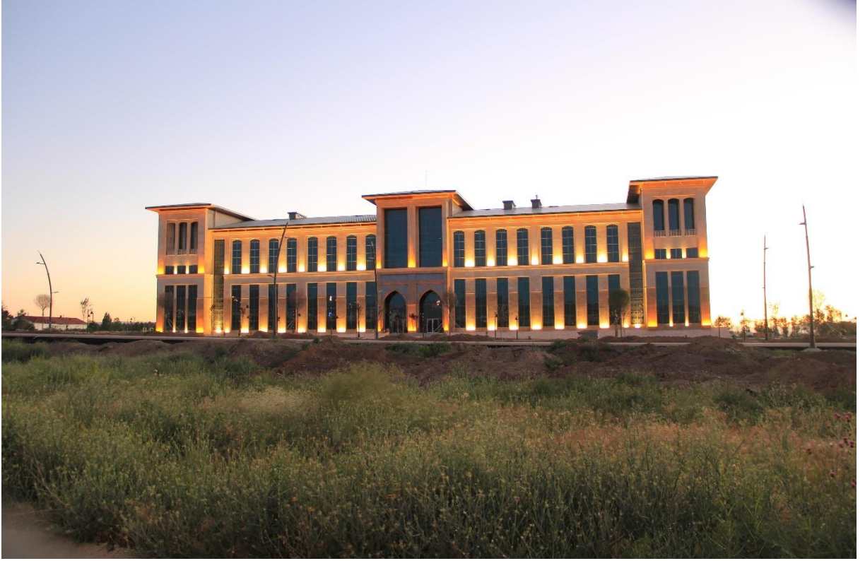
Resim 2: Rektörlük Binası

Üniversitemiz Rektörlük binası 3.287 m 2 bir zemin genişliğine sahip olup toplam kapalı alanı 12.576 m 2 dir. Rektörlük binası içerisinde Öğrenci İşleri Daire Başkanlığı, Yapı İşleri ve Teknik Daire Başkanlığı, Strateji Geliştirme Daire Başkanlığı, Bilgi İşlem Daire Başkanlığı, İdari ve Mali İşler Daire Başkanlığı, Personel Daire Başkanlığı, Sağlık Kültür ve Spor Daire Başkanlığı, Genel Sekreterlik ile üniversitemiz araştırma merkezlerinin ofisleri bulunmaktadır.