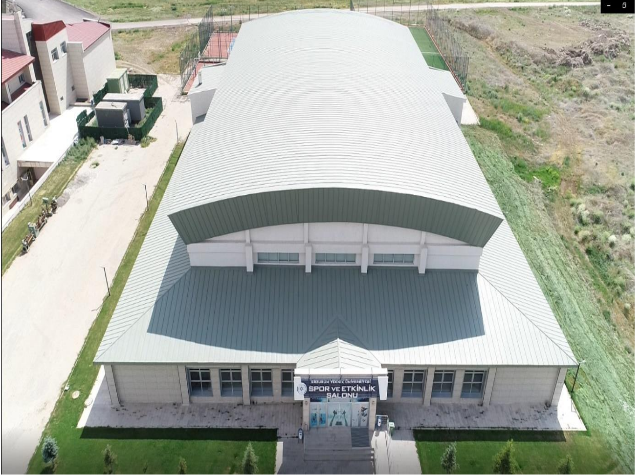
Resim:2 Kapalı Spor Salonu

Spor salonu olarak kullanılmak üzere yapılan 3.178 m 2 'lik ek derslik binası 2017 yılı sonu itibariyle kapalı spor salonuna dönüştürülmüştür.