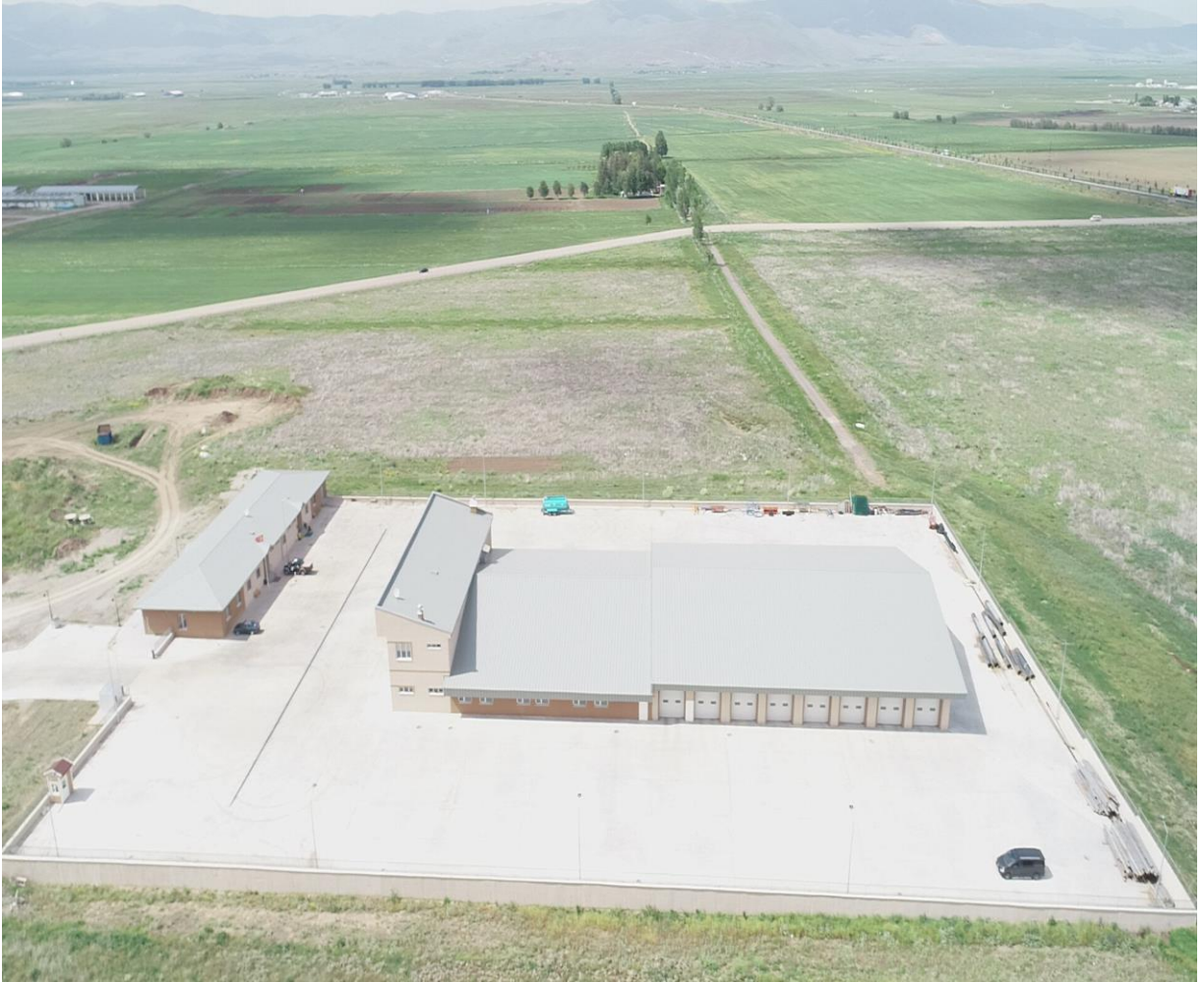
Resim 10: Merkezi Kapalı Garaj

Kış mevsiminin uzun ve sert geçtiği bir bölgede olması sebebiyle üniversitemiz, T Cetvelinde kayıtlı olan araçların daha iyi çalışması ve zamanında hizmet vermesi amacıyla yatırım projesine alınan ve yapımı tamamlanan 3.243 m 2 kapalı garaj 2018 Yılında tam kapasite ile faaliyete girmiştir.