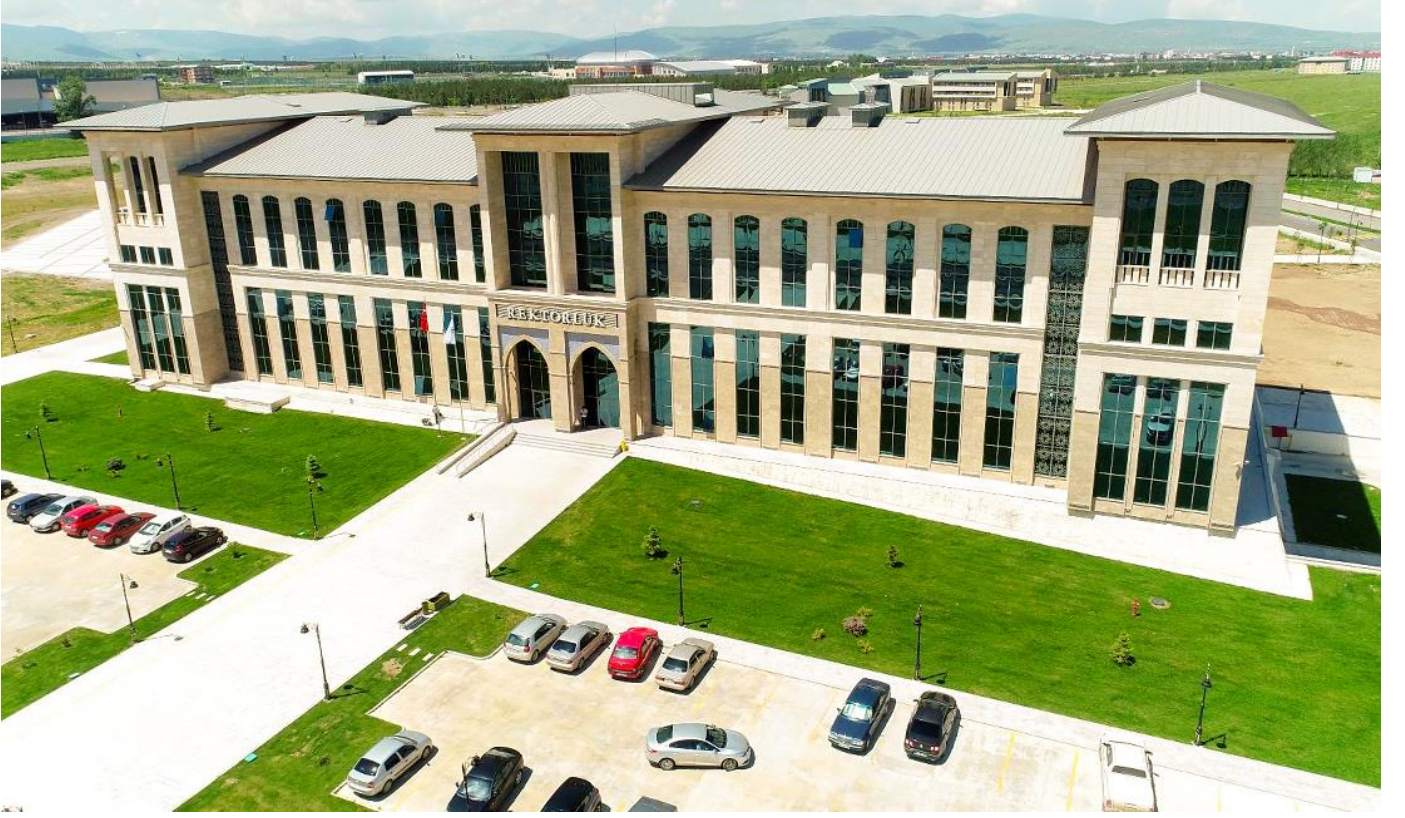
Resim 5: Rektörlük Binası

Ayrıca Selçuklu, Osmanlı dönemi ve Cumhuriyet dönemi mimarisinin bir sentezi olarak inşa edilen 12.578 m 2 'lik Rektörlük binamız 2016 yılında tamamlanarak hizmete girmiştir.