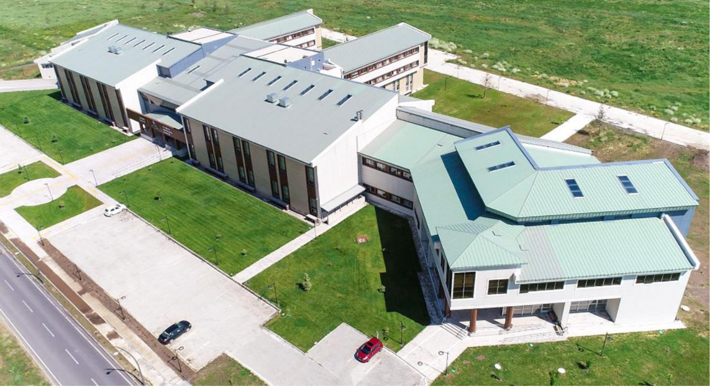
Resim 3: İktisadi ve İdari Bilimler ile Edebiyat Fakültesi

Ardından İktisadi ve İdari Bilimler Fakültesi ile Edebiyat Fakültesine hizmet verecek olan 19.581 m 2 'lik İktisadi ve İdari Bilimler Fakülte binası tamamlanmış olup fakültelerin öğrencileri bu binada eğitimlerini sürdürmektedirler.