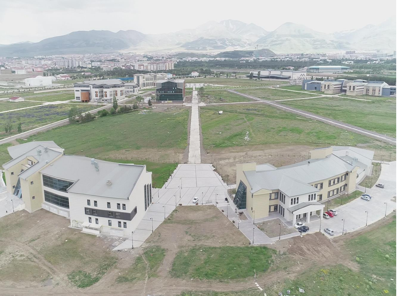
Resim 8 : I.ve II. Etap Öğrenci Yaşam Merkezi

2016 yılında temeli atılan Öğrenci Yaşam Merkezinin ilk etabı olan merkezi yemekhane kısmı tamamlanarak hizmet vermeye devam etmektedir. Devam eden süreçte öğrenci çarşısı ve sosyal yaşam donatıları ile hızla gelişecek olan Öğrenci Yaşam Merkezinin diğer kısımların yapımı da tamamlanarak hizmete açılmıştır. Ayrıca yapımı tamamlanan 48 adet lojmanın tahsisleri yapılarak kullanılmaya başlanmış, 16 adet lojmanın ise inşaatı 2019 yıl sonu itibariyle tamamlanarak hizmete girmesi hedeflenmektedir. Üniversitemiz içerisinde 10.500 metre bisiklet, yürüyüş ve araç yolu alt yapısı ve ışıklandırması tamamlanarak ulaşım ihtiyaçlarına cevap verilmiştir.