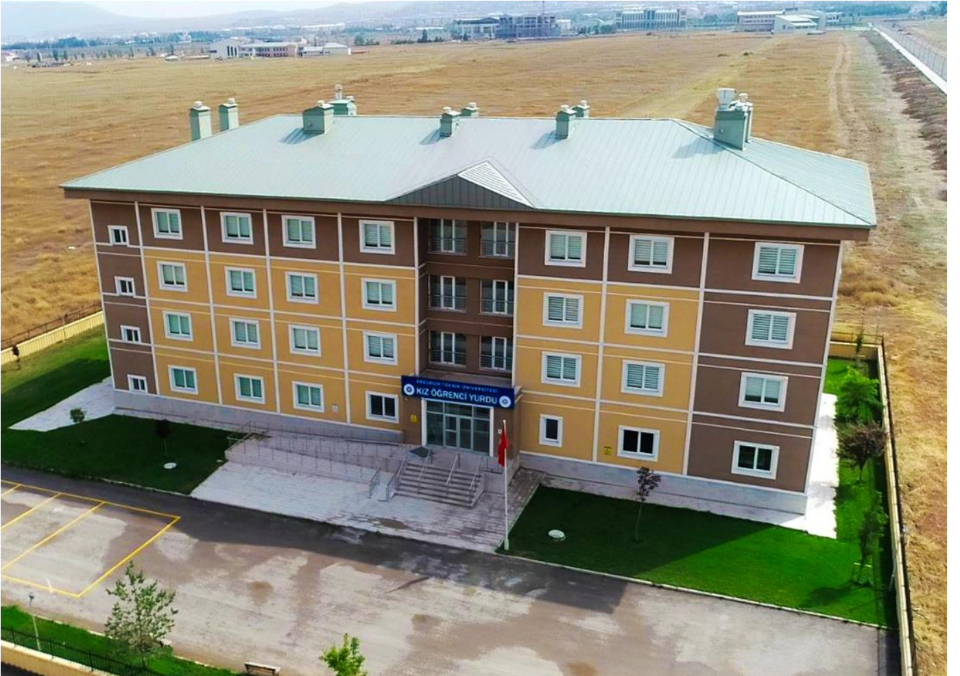
Resim 6: Yurtlar

İş Bankası tarafından üniversitemize bağışlanan 152 öğrenci kapasiteli kız öğrenci yurdumuz 2018-2019 Eğitim-Öğretim Dönemi sonuna kadar aktif olarak hizmet etmiş olup öğrencilerimizin barınma ve sosyal yaşam ihtiyaçlarına cevap vermiştir. 2019 Yılı Eylül ayı itibariyle Üniversitemizin Sosyal Tesisler Müdürlüğü bünyesinde tadilata alınan yurt binası, yıl sonunda tamamlanarak misafirhane olarak hizmet vermesi hedeflenmektedir. 2017 yılı içerisinde 1500 kişilik Kredi ve Yurtlar Kurumu yurtları da kampüs alanımızda hizmete girmiş olup toplu taşıma güzergahlarıyla da öğrencilerin ulaşım imkanları kolaylaştırılmıştır.