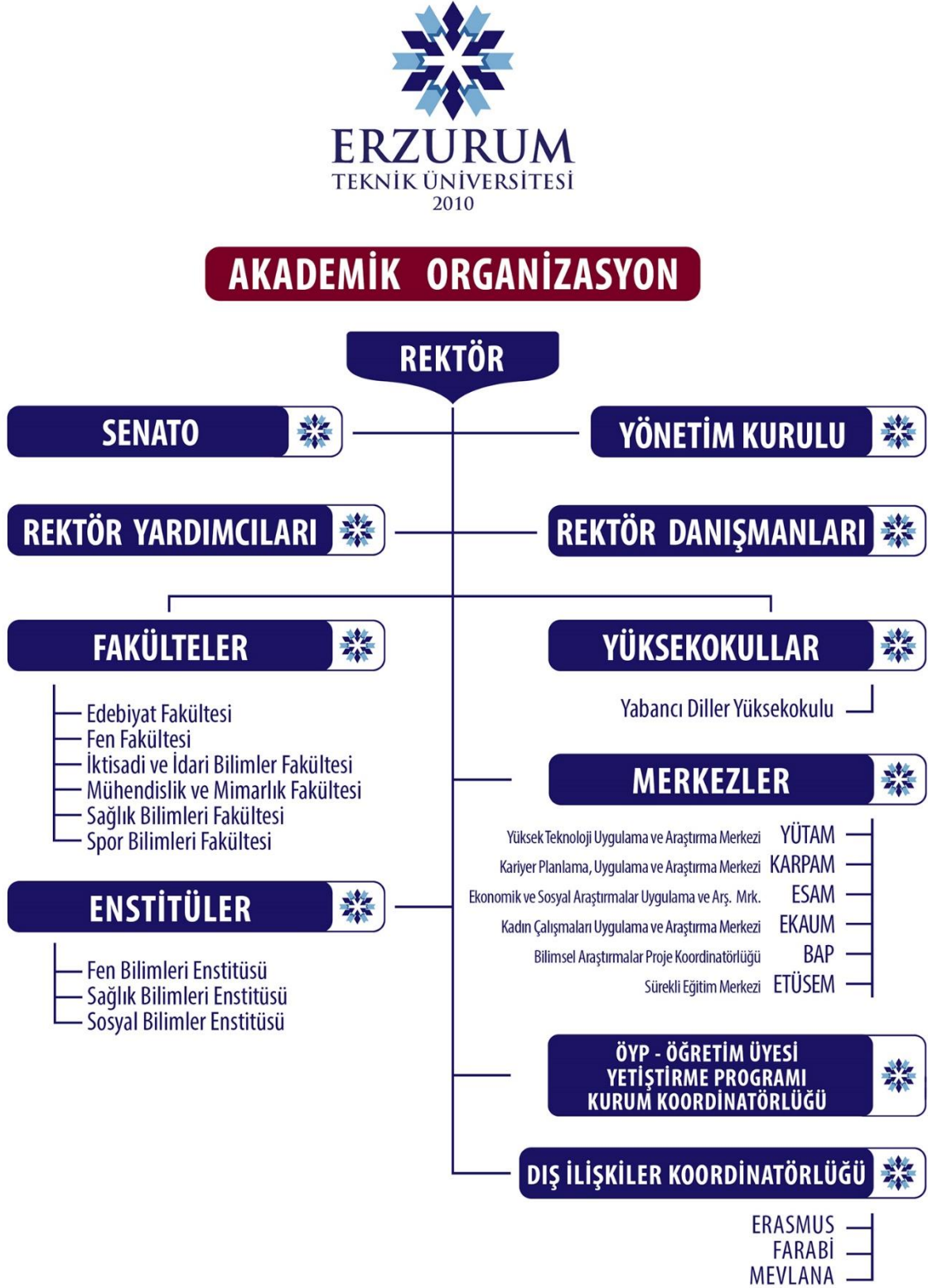
Şekil 1: Erzurum Teknik Üniversitesi Akademik Birimler Organizasyon Şeması