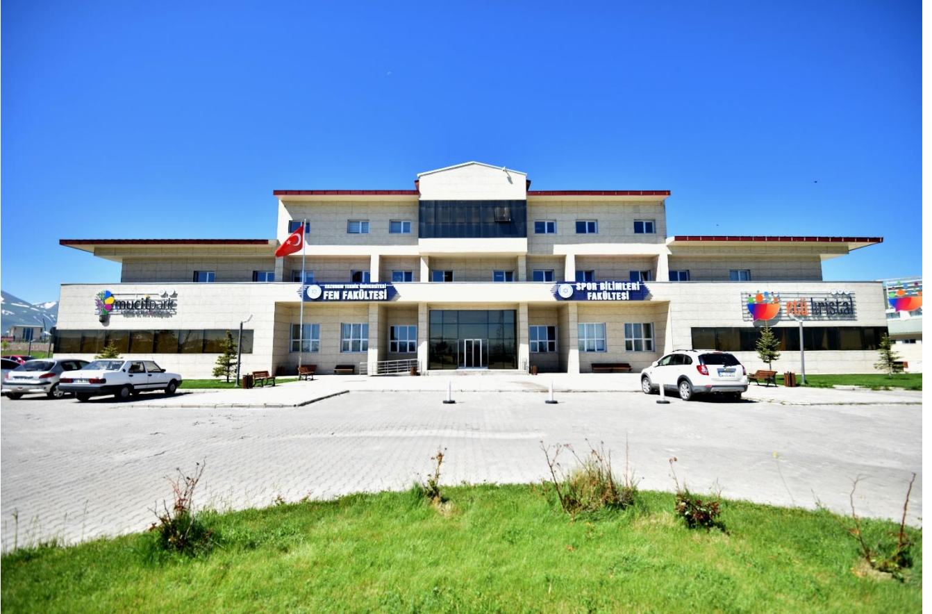
Resim:1 Fen Fakültesi ve Spor Bilimleri Fakültesi

İlk olarak 6250 m 2 ’lik merkezi derslikler binasının tamamlanması ile öğrencilerimizin eğitim standartları ve sosyal donatıları için önemli bir adım atılmıştır. Bahse konu merkezi derslikler binası 2017 yılı sonu itibariyle Fen Fakültesi ve Spor Bilimleri Fakültesi olarak hizmet vermeye başlamıştır.