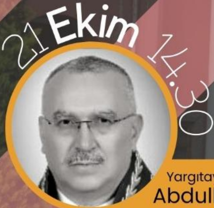
Yargıtay 6. HD. Üyesi Abdullah ERGİN

Cumhurbaşkanlığı Hükümet Sisteminde Denge ve Denetim Araçları