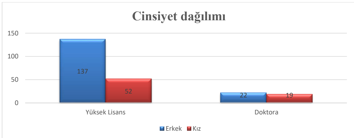
Grafik 2. Öğrencilerin Cinsiyetlerine Göre Dağılımı