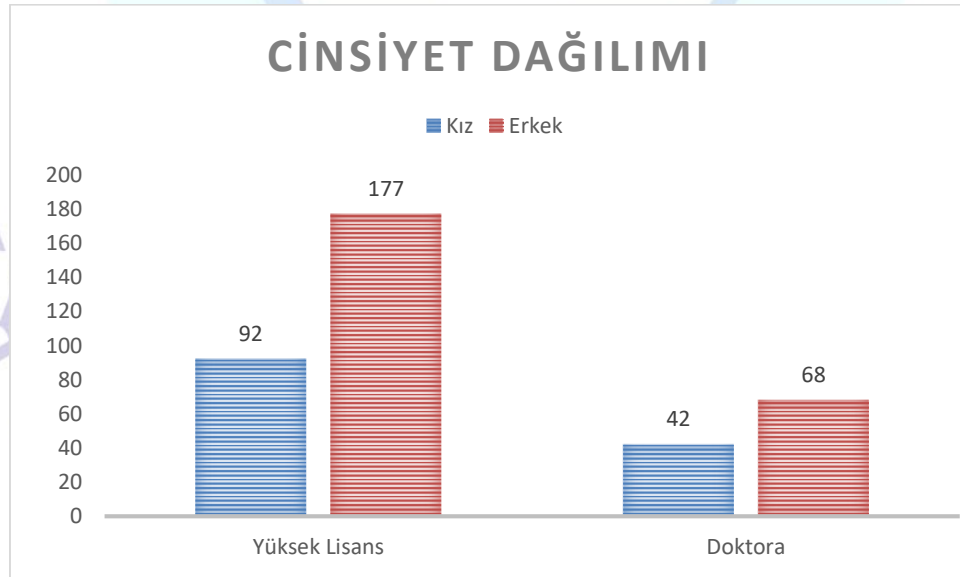
Grafik 2. Öğrencilerin Cinsiyetlerine Göre Dağılımı